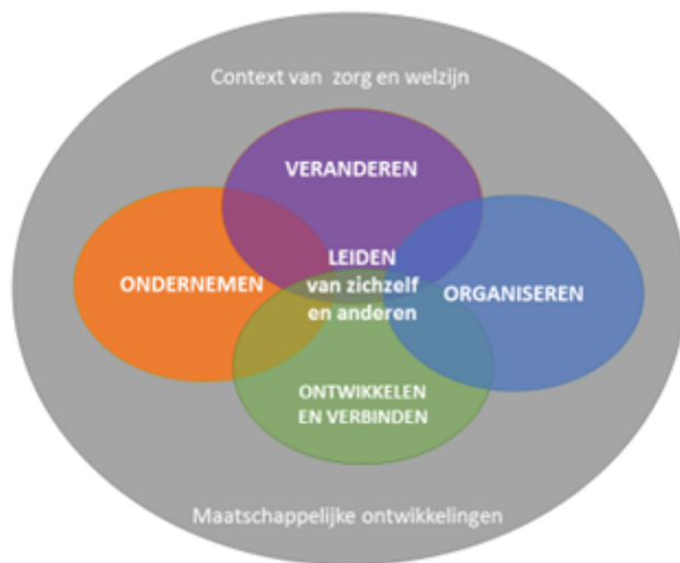
Figuur 2: model MiZ

Het model beeldt het kijken vanuit telkens andere perspectieven en belangen uit en symboliseert tevens de dynamiek van de context waarin perspectieven en belangen kunnen schuiven en elkaar overlappen.