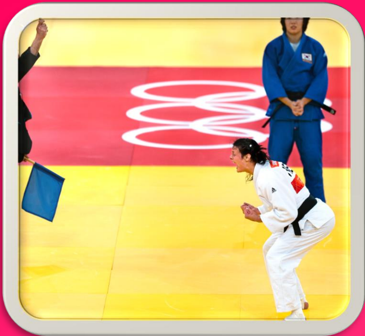
Wereld kampioen 3 Olympische medailles