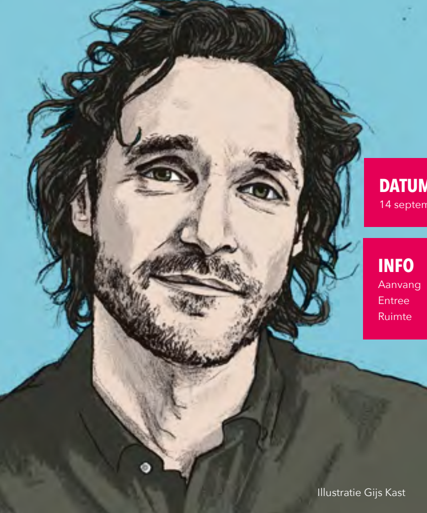
Illustratie Gijs Kast