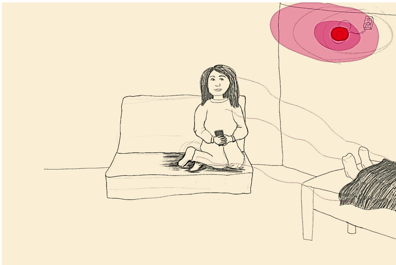
Figuur 1 Het lijntje tussen ons.

betekenisvol contactmoment soms ook zit in ogenschijnlijk niets doen, en dat ze hun waardering daarvoor ook uitspreken.