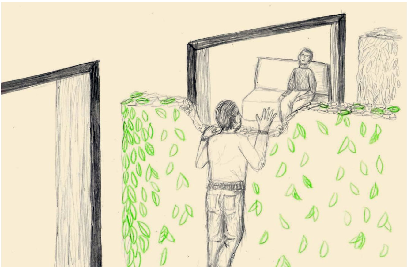
Figuur 2 Gewoon de heg wat lager.

Een begeleider vertelt tijdens een observatie dat ze het belangrijk vindt om op de woongroep samen te koken, zodat de bewoners de beleving van geuren en smaken meekrijgen. Ze betrekken de bewoners bij het kookmoment: de een roert in de pan, de ander gooit een aardappel in de pan, de derde ruikt aan de pan (zie figuur 3). Een andere begeleider beschrijft wat dat met haar doet: “ We betrekken bewoners bij alles wat we doen. Dat lijkt misschien zwaar, maar daar laad ik ook juist van op. Deze verbinding, niet de rapportage, maakt dat ik blij naar huis ga. ” Ook de naasten ondersteunen op verschillende manieren bij kookmomenten. Op een woongroep komt een naaste elke week soep koken, bij een andere woongroep zit een naaste in de voedingscommissie.