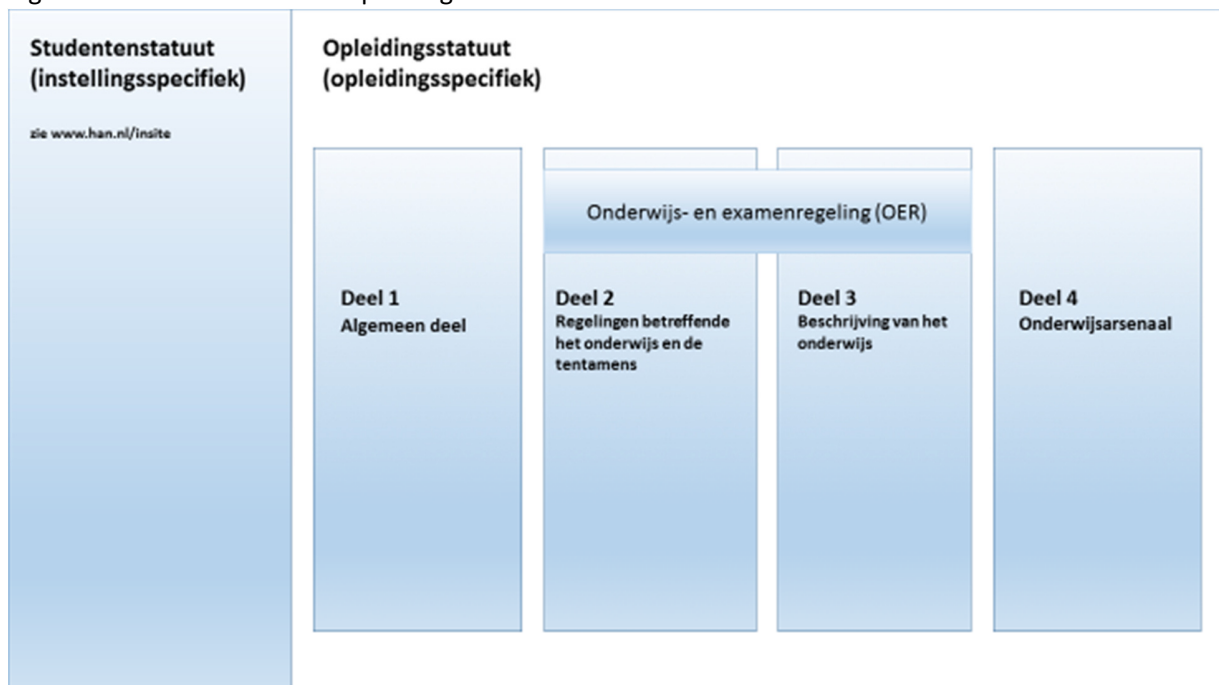
Figuur: Studentenstatuut en Opleidingsstatuut

Omdat in de OER alleen maar wordt beschreven hoe de leeruitkomsten en de toetsing en beoordeling binnen de eenheden van leeruitkomsten 2 er uit zien, is een apart document nodig om het onderwijsaanbod te beschrijven dat wij jou bieden. Deze beschrijving vind je in het onderwijsarsenaal.