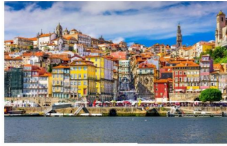
UNIVERSIDADE CATÓLICA PORTUGUESA) PORTO, PORTUGAL

Mogelijke vakken (Engelstalig): European Union Law, Private International Relations - Introduction and General Theory of the Conflict of Laws, International Law Regimes, Maritime Law, Private International Law, Public Law, International and European Refugee Law, Common Law Contracts and Sales, Intellectual Property Law, Law and Life, English for Law