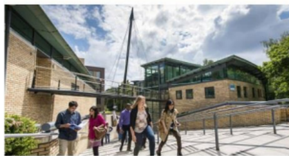
KINGSTON UNIVERSITY LONDON KINGSTON UPON THAMES, UNITED KINGDOM

Mogelijke vakken (Engelstalig): EU Law, International and Comparative Law, Lawyers and their Clients, Commercial Law