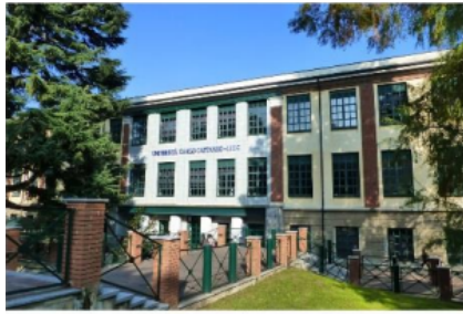
LIUC UNIVERSITÀ CARLO CATTANEO (LIUC) CASTELLANZA, ITALY

Mogelijke vakken (Engelstalig): International Business Law, European Contract Law, White Collar Crimes, Introduction to Italian Law, Cambridge English: Legal (ILEC), International Business Communication, (International) Tax Law, Merger and Acquisition Law, Intercultural Competences, Italian level I