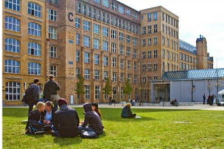
HOCHSCHULE FÜR TECHNIK UND WIRTSCHAFT BERLIN (HTW BERLIN) BERLIN, GERMANY

Mogelijke vakken (Duitstalig): Gesellschaftsrecht, Deutsches und europäisches Staats- und Verfassungsrecht, Arbeitsrecht, Kartellrecht, Internationales Privatrecht und Internationales Kaufrecht