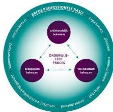
figuur: landelijke bekwaamheidseisen lerarenopleidingen

Voor het beroep van docent zijn landelijk zogenaamde bekwaamheidseisen vastgelegd. Die eisen gelden voor alle lerarenopleidingen. Ze zijn in dit figuur weergegeven: