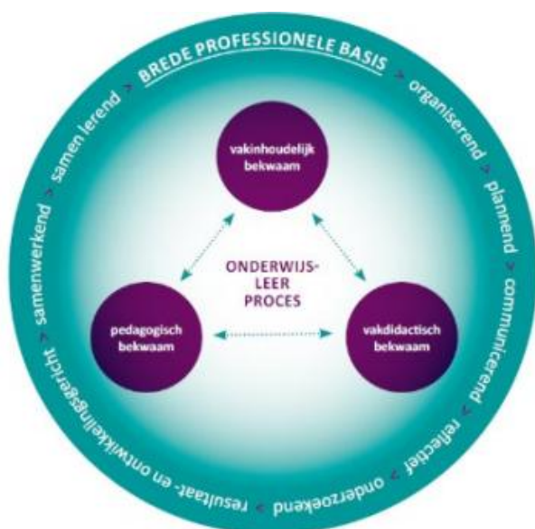
Figuur 3: Landelijke bekwaamheidseisen leraar (2017)

Voor het beroep van leraar zijn landelijk zogenaamde bekwaamheidseisen (2017) vastgelegd. Ze beschrijven wat leraren minimaal moeten weten en kunnen. Die eisen gelden voor alle lerarenopleidingen en dienen als ijkpunten voor opleidings- en bekwaamheidsonderhoud van leraren. Ze zijn in dit figuur 3 weergegeven.