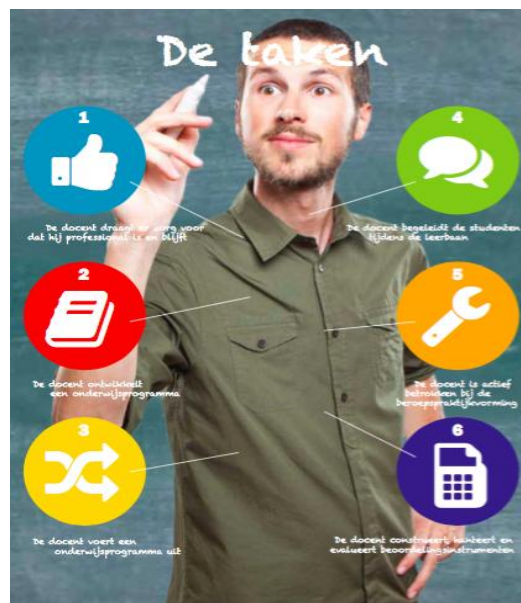
Figuur 2: Kwalificatiedossier mbo-docent