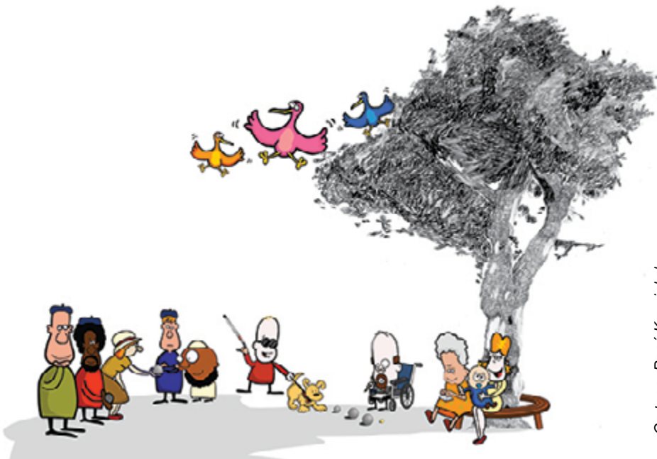
Cartoon: René Krewinkel

Sofie onderstreept haar verhaal aan de hand van het beeld van de avontuurlijke bergschoen. “Samenwerken is echt ‘on the road’ leren terwijl je op weg bent. Je kan er heel veel over leuteran, maar je moet het gewoon gaan doen. Door die weg te gaan leer je over het pad. Je moet eerst die schoenen aan doen en beginnen en dan val je sowieso in diepe of ondiepere putten, maar dat merk je dan wel. Daar moet je dan ook niet te bang voor zijn. Als je samenwerkt met ervaringsdeskundigen, dan haal je wel problemen in huis (lacht). De communicatie loopt niet altijd makkelijk en je verplaatsen van de ene plek naar de andere is niet evident. Dat is part of the game. Toch maar die schoenen aan trekken. Of zoals Pipi Langkous zegt: ‘ik heb het nog nooit gedaan, dus ik denk dat ik het wel kan’.”