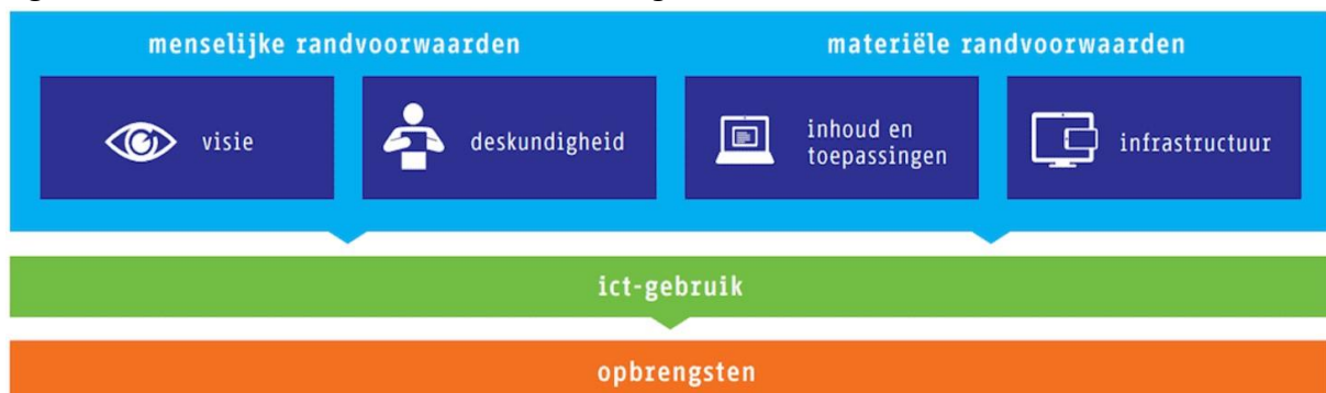
Figuur 1. Vier in balansmodel ©Schouwenburg

Voor een effectieve implementatie op deze schaalgrootte gebruikte we het Vier in Balans model (figuur 1). Opschaling vereist een heldere strategische visie, beschrijving van inhoud de aanschaf van materiële middelen zoals VR-brillen, en het opzetten van een robuuste technische infrastructuur. Deskundigheidsbevordering is van cruciaal belang, zodat docenten VR zelfstandig en effectief binnen hun onderwijspraktijk kunnen integreren.