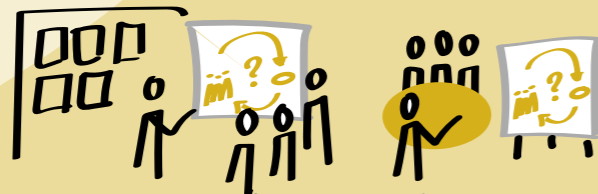
Teams bij zorgaanbieders en RET's

We organiseren leerlussen om kennis en vaardigheden te verspreiden vanuit de praktijk, onderzoek, onderwijs en ervaringsdeskundigheid.