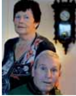
Fam. De Wildt Zorggebruikers

'Geen betere reclame dan een student die mee verantwoordelijk- heid neemt'