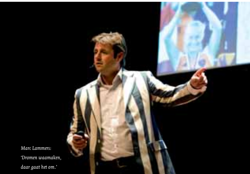
Marc Lammers: 'Dromen waarmaken, daar gaat het om.'

de verschuiving naar een zelfstandige praktijk. Het meest spraakmakend is de bijdrage van Marc Lammers, bondscoach van het nationale dameshockeyteam. Samenwerking en coaching zijn Lammers' onderwerpen. Hij is een aanstekelijk verteller, de zaal luistert met open mond. Zelfs als hij zijn gehoor, dat net als de beroepsgroep, voornamelijk uit vrouwen bestaat, aanspreekt met 'Jongens...', protesteert er niemand. Dromen waarmaken, daar gaat het volgens hem om. 'Op een gegeven moment kom je in een flow. Dan lukt alles.' En bij coachen moet je voor elke negatieve opmerking acht complimenten geven. 'Een pijnprikkel komt namelijk vier keer harder aan dan een plezierprikkel', weet hij uit eigen ervaring.