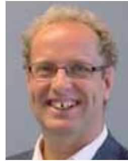
Dort Spierings Lectoraat i.o. Zorggericht Bouwen, HAN

'Wij denken dat senioren liever echte knoppen hebben'