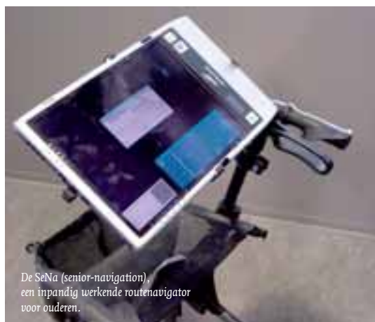
De SeNa (senior-navigation), een inbandig werkende routenavigator voor ouderen.

Tegelijk zal heel de mondzorgketen worden doorgelicht. Worden signalen in de ene schakel wel verderop opgepakt? Van Deutekom: 'Willen we dit vergrijzingsprobleem oplossen dan moet de zorgketen beter samenwerken.' HAN-studenten zullen daartoe aanbevelingen doen. Voorts zullen ze in kaart brengen welke technische oplossingen en hulpmiddelen er nodig zijn. Op voorhand kun je denken aan nieuwe poets- en spoeltechnieken waarbij het regionale bedrijfsleven kan worden betrokken.