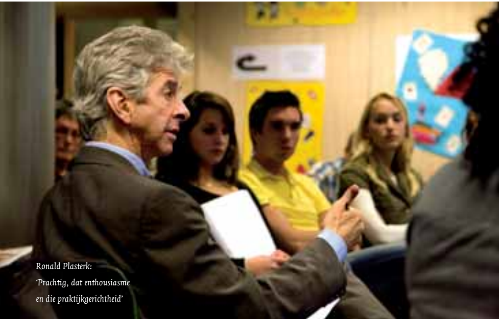
Ronald Plasterk: 'Prachtig, dat enthousiasme en die praktijkgerichtheid'

Eind september bracht Ronald Plasterk, minister van Onderwijs, Cultuur en Wetenschap, vrij onverwacht een bezoek aan de Hogeschool van Arnhem en Nijmegen. Wat opviel die dag was dit: interesse in gelikte powerpoint presentaties en pr-verhaaltjes van directeuren heeft de bewindsman niet. Plasterk wil de praktijk aan het werk zien en met studenten praten. Dat doet hij veelvuldig. Bij de Informatica en Communicatie Academie (ICA) overvalt hij letterlijk enkele studenten Multimedia Design die bezig zijn met het blad Kidsweek. 'Wat doen jullie precies?' Ze schrikken even, maar geven dan graag uitleg. Even later wordt een tweetal lessen verstoord. Plasterk is vooral gecharmeerd van de prak-