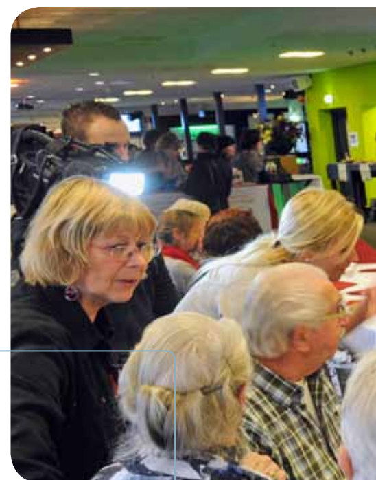
Op de dag van de mantelzorg kregen Nijmeegse mantelzorgers leuke workshops en nuttige informatie aangeboden.

Talis denkt daarin mee. Van de Wall: ‘We overwegen de mogelijkheid om tijdelijke mantelzorgwoningen, een soort woonunits, te plaatsen. Hoe langer de reisafstand tussen zorgvrager en mantelzorg(er), des te minder tijd blijft er over voor de eigenlijke zorg. Met een tijdelijke mantel-