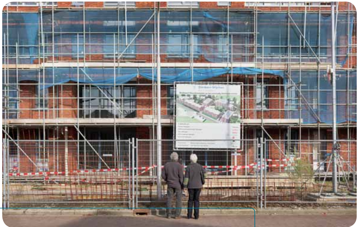
Langzaam wordt duidelijk hoe de nieuwbouw van de (mantel)zorgwoningen aan de Sperwerstraat er uit komt te zien.

geloofd Van Biene. ‘Ik zie een belangrijke rol voor “social workers” die samen met de zorgvrager en mantelzorg(er)s vooraf in kaart brengen wat er eigenlijk nodig is. Wat kan het eigen netwerk opbrengen en waar moet professionele hulp ingeschakeld worden? In Nijmegen wordt momenteel gewerkt aan de ontwikkeling van sociale wijkteams, waar zo’n social worker deel van uit zou moeten maken. Deze nieuwe professionals overstijgen hun organisatie; het zijn generalisten die goed in staat zijn het gesprek te voeren met de zorgvrager én het netwerk om zo tot een optimale verdeling te komen.’