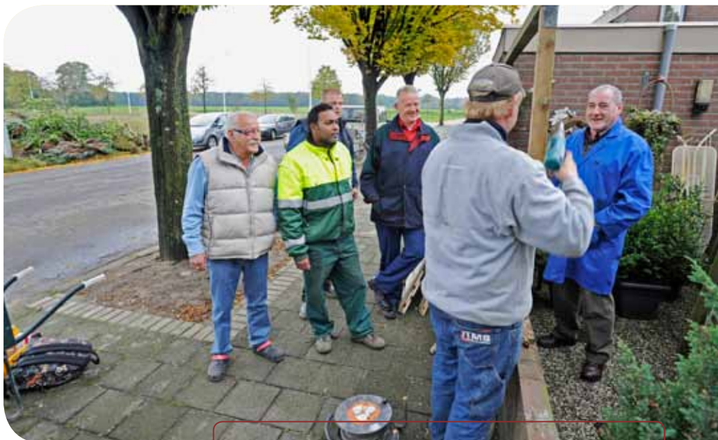
De werknemers van 2Switch verwijderen in opdracht van Talis en de bewoner een hoge boom uit de tuin.